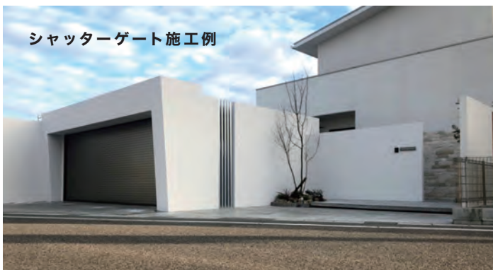
シャッターゲート施工例

隣地との境界・プライベート空間を守ってくれる「ブロック塀」や「境界フェンス」。ブロック塀や境界フェンスをつけたはいいが、高さが低く「隣地・道路から丸見え」「視線が気になる」「落ち着かない」「光をいれたいけど、カーテンを開けられない」「建物外観とデザインがあっていない」など、お悩みはありませんか?そんなお悩みを解決する新しい塀“GroundArt Wall|グランドアートウォール”が登場!!自由に加工ができる特殊発泡素材を採用し、「塀の高さ」・「デザイン性」をつくりだすことが可能となりました。