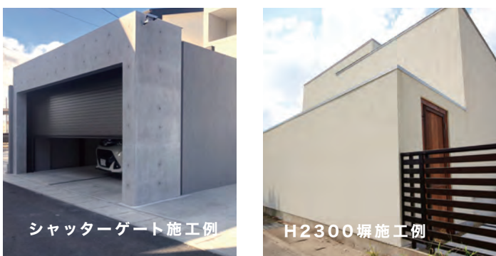
シャッターゲート施工例